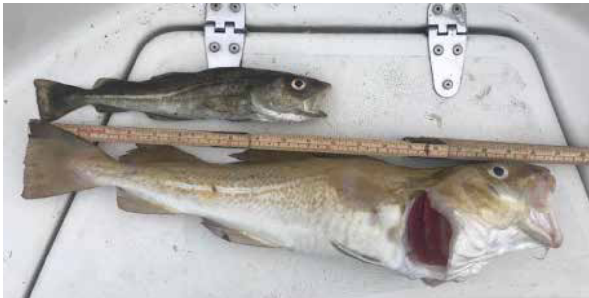
Figur 1. Torskar fångade som bifångst i hummertinor i Byfjorden 25 september 2019. DNA-analys (Carl André, personligt meddelande till L-O A) visar att den övre torsken är en Kusttorsk eller Kattegattorsk (längd 30 cm, vikt 220 gram). Undre torsken är en lekmogen Nordsjötorsk (längd 53 cm, vikt 1330 gram).

Skarvar predaterar på torskbeståndet vilket motverkar effekten av fiskeförbudet i fjordsystemet. Predationen kan äventyra positiva effekter av konstgjorda rev. Syftet med föreliggande rapport är