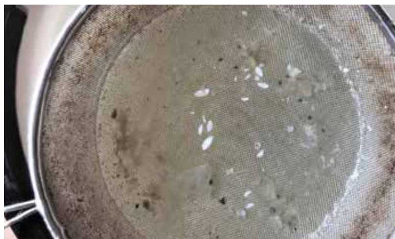
Figur 3. Öppnad spyboll från Ringburen 5 september 2020 (vänster). Durkslag med de framvaskade otoliterna (höger).