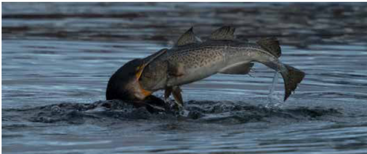
Figur 2. Skarv som sväljer nyfångad torsk. (Foto Patrik Eld, Lysekil).

att undersöka hur mycket torsk som konsumeras av mellanskarv i Byfjorden (Figur 2). Skarvar övernattar i Byfjorden på öarna Ringburen och Lillön. Under övernattning producerar skarven en så-kallad spyboll vilken innehåller otoliter (hörselstenar) och andra svårsmälta beståndsdelar av födan (Figur 3). Vår analys är baserad på innehållet av otoliter från torsk i 76 färsk spybollar vilka samlades in från Ringburen. Otoliter separeras från spybollarna och längden av otolitparen från torsk mäts. För att bestämma vikten av varje torsk vars otoliter återfunnits i en spyboll använder vi en matematisk formel för sambandet mellan otoliternas längd och fiskens vikt. Denna formel baseras på data från 45 torsk